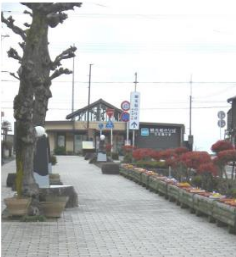
①近江今津駅から今津港までの通り