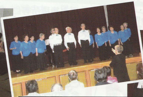
会場に美しい歌声が流れました