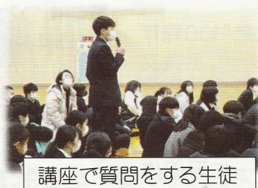
講座で質問をする生徒