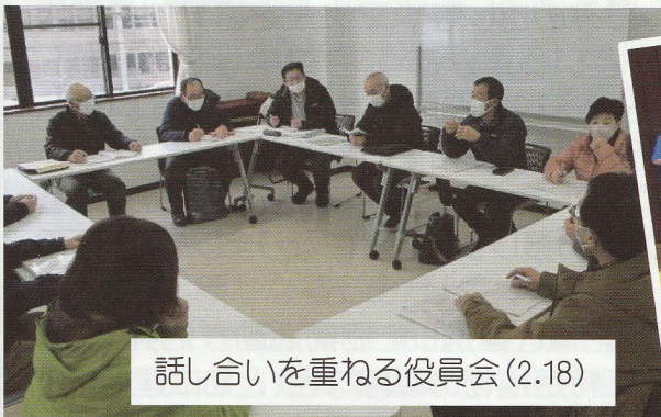
話し合いを重ねる役員会(2.18)

ただ今、趣旨に賛同いただける方の会員を募集しています。お問い合わせは、今津東コミュニティセンター（今津公民館）内当協議会まで。